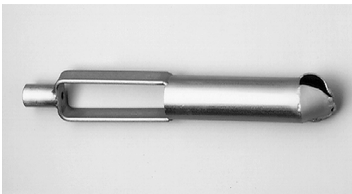
Modelo 0232D2-100, Sonda-Arena